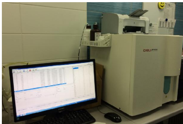
Анализатор гематологический DIRUI модель BF-6500

Схема пломбировки от несанкционированного доступа, обозначение места нанесения знака поверки представлены на рисунке 2.