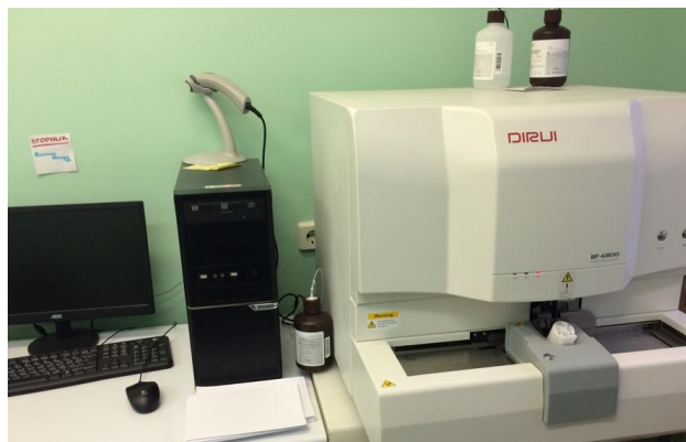
Анализатор гематологический DIRUI модель BF-6800